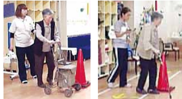
初回(シルバーカーで歩行)

「立つ」「歩く」「周る」「向きを変える」「座る」という一連の動作を測定します。 生活に直結した重要な評価なので、動画撮影も合わせて行うことで改善点が把握できます。