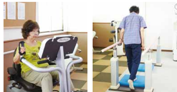
持久力/バイオステップ